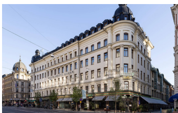
Elite Hotel Adlon.

Efter en god frukostbuffé på hotellet finns tid för shopping och lunch före hemresan till Värmland kl. 14.00. Vi stannar för en liten rast även på hemresan, åter i Karlstad ca kl. 18.30.